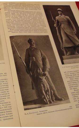
С. А. Базаров. Офицерские танцы.

Скульптура — это искусство, которое помогает людям выстоять и победить. Она должна быть связана с жизнью народа, с его борьбой за свободу и независимость. В условиях войны искусство становится оружием, которое помогает людям выстоять и победить.