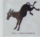
Слай — символ фермера.