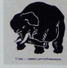
Слай — символ республиканства.