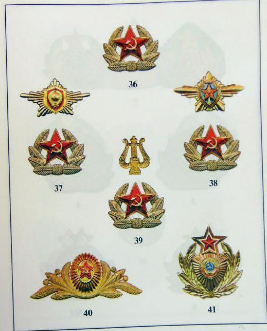
36. Старшины, сержанты, солдаты, курсанты, 1969. 37-38. Сержантский и рядовой состав роты Почетного караула, 1969. 39. Сержантский и рядовой состав сводного Военного оркестра, 1969. 40. Marshals родов войск и генералы (повседневная форма), 1988. 41. Офицеры, прапорщики, военнослужащие сверхсрочной службы (проектный образец), 1990.