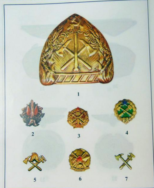
1. Личный состав пожарных команд и организаций (на касках), 1925. 2. Высший начальствующий состав, 1923. 3-4. Пожарно-сторожевая охрана Наркомата тяжелой промышленности, 1934. 5. Рядовой и младший начсостав, 1927. 6. Члены пожарных бригад Осоавиахима УССР, 1930. 7. Работники городской пожарной охраны и госпонадзора, 1932.