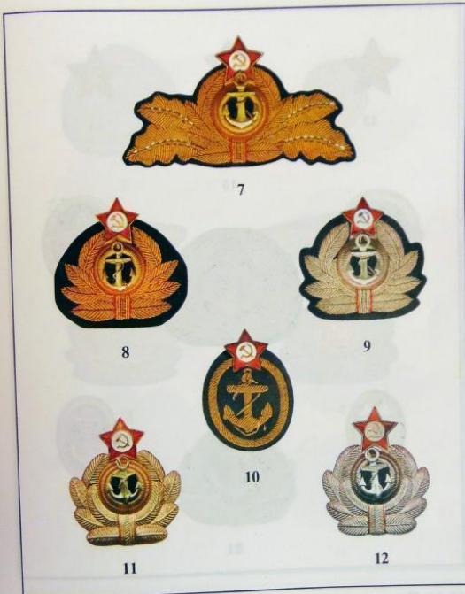
7. Адмиралы (кроме Адмиралов флота Советского Союза), 1943. 8. Офицеры и мичманы, адмиралы и генералы ВМФ (повседневная форма), 1958. 9. Инженерно-командный состав (адмиралы - на повседневной форме), 1958. 10. Главные старшины, старшие сержанты, 1940. 11-12. Офицерский состав корабельной и инженерно-корабельной служб, 1964.