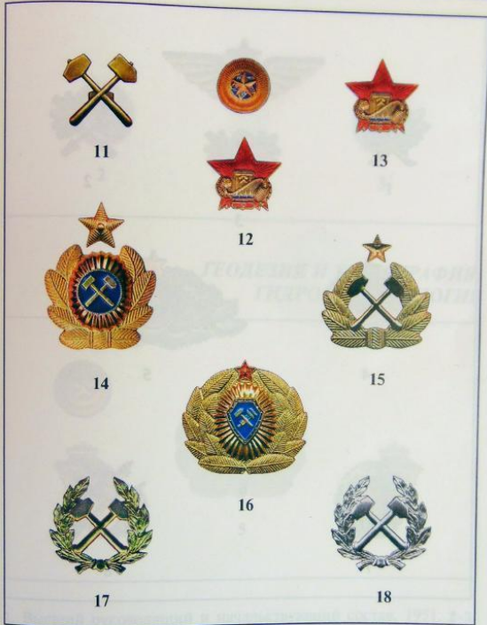
11. Рядовой и младший начсостав, 1947. 12. Руководящий состав военизированных горноспасательных частей, 1953. 13. Рядовой и младший начальствующий состав ВГСЧ, 1953. 14. Высший, старший и средний комсостав ВГСЧ, 1977. 15. Рядовой и младший комсостав ВГСЧ, 1977. 16. Руководящий состав Госгортехнадзора СССР, 1986. 17-18. Почетные шахтеры, 1975.