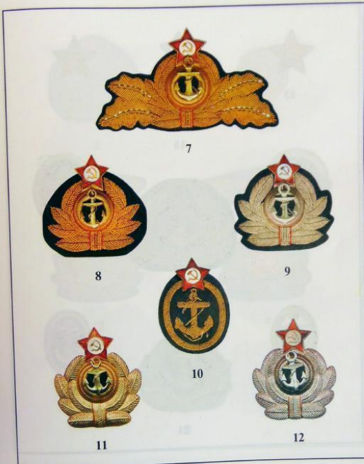
7. Адмиралы (кроме Адмиралов флота Советского Союза), 1943. 8. Офицеры и мичманы, адмиралы и генералы ВМФ (повседневная форма), 1958. 9. Инженерно-командный состав (адмиралы - на повседневной форме), 1958. 10. Главные старшины, старшие сержанты, 1940. 11-12. Офицерский состав корабельной и инженерно-корабельной служб, 1964.