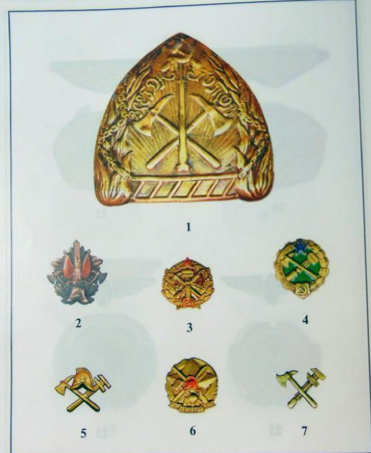
1. Личный состав пожарных команд и организаций (на касках), 1925. 2. Высший начальствующий состав, 1923. 3-4. Пожарно-сторожевая охрана Наркомата тяжелой промышленности, 1934. 5. Рядовой и младший начсостав, 1927. 6. Члены пожарных бригад Осоавиахима УССР, 1930. 7. Работники городской пожарной охраны и господанадзора, 1932.