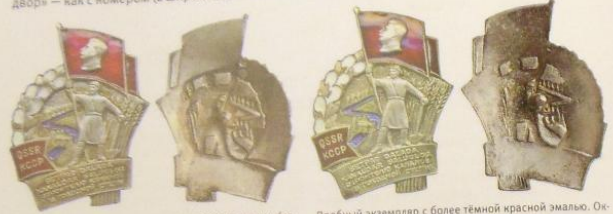
Пробный экземпляр значка с двухцветной белой эмалью (на лопеке). Без оксидирования фона и золочения колосьев.

Малое количество награждений связано с весьма скромными успехами в строительстве системы каналов Голодной степи в начале 40-х годов. В её развитии приняли участие тысячи заключенных огромного Карагандинского ИТЛ — Карлага, отдел земледелия которого имел особую службу мелиорации и ирригации.