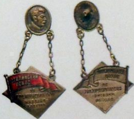
3-188. Памятный наградной жетон «Сталинский поход за Социалистическое животноводство», 1933 г. Металл: железо, меднение, серебрение Цена: 25 000 Р