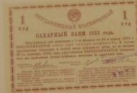
Облигация государственного краткосрочного сахарного займа на 1 руб. СВ4393. 1923 г.