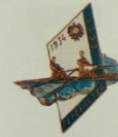
1.79. Памятный знак первенства СССР по гребле 1934 г. Металл: томпак Цена: 25 000 Р