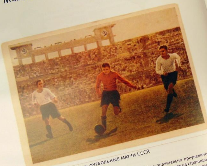
ПЕРВЫЕ МЕЖДУНАРОДНЫЕ ФУТБОЛЬНЫЕ МАТЧИ СССР. СССР — Турция, Турция — СССР

Все товарищеские матчи, сыгранные сбор- ной РСФСР в 1923 году, в мировой футбольной истории считаются неофициальными, так как не входили в календарь ФИФА и не входят в статистику международных матчей.