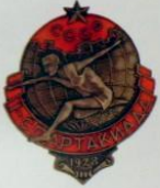
1.23. Памятный знак Всесоюзной спартакиады 1928 г. Металл: серебро Цена: 45 000 Р

В соревнованиях приняло участие 7125 спортсменов, из них 612 — представители иностранных рабочих спортивных организаций 17 стран. Самые крупные зарубежные делегации прибыли из Германии и Финляндии.