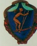
1.76. Памятный знак чемпионата СССР по лыжам 1923 г. Металл: томпак Цена: 45 000 Р

Первенства СССР по различным видам спорта проводились с 1922 г. в различных городах. Победителю присваивали звание чемпион СССР. В 20—30 годы призерам первенств СССР и участникам выдавались наградные или памятные жетоны, выпуск которых не был строго регламентирован.