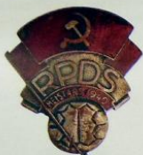
1.185. Призовой знак чемпиона Латвийской ССР по футболу 1940 г. Металл: томпак Цена: 30 000 Р