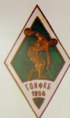
1.413. Знак выпускника ГОИФКБ 1956 г. Металл: томпак Цена: 10 000 Р

сразу после освобождения Минска немецких войск, с первого октября 1944 возобновилась работа института. Его здания и спортивные объекты восстанавливались новыми силами преподавателей и студентов.