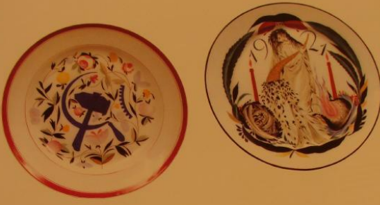
Тарелка «Синий герб» с эмблемой «серп и молот» на фоне полевых цветов. 1918 Чехосл. С. В. — автор рисунка Фарфор, наглазурная роспись. Дн 23,4 ГФЗ Марка ГФЗ подглазурная кобальтом с белой эмалью цифра «17» и серо-голубым

Designed by S.V. Chekhonin State Porcelain Factory, Petrograd Porcelain, overglaze painting SPF mark in cobalt underglaze date '17 impressed into the paste, initial greyish-blue by the maker 4.9 x 6 cm