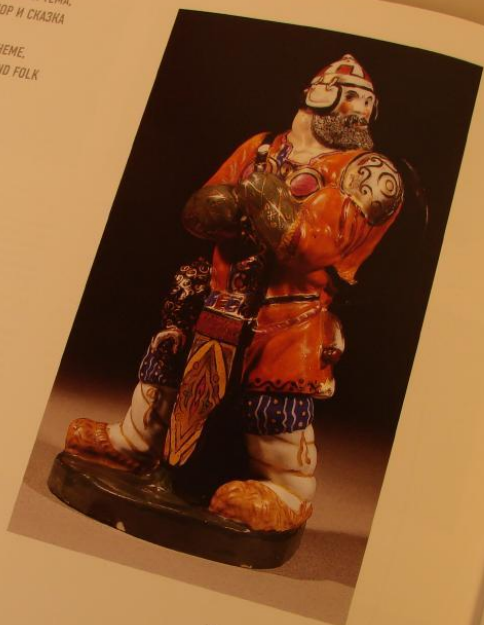
276 Скульптура "Русский богатырь". Начало 1920-х Данте Е. Е. — автор модели Фарфор — белая масса, надглазурные крышки и рисунки, позолота. В. 27,8 Гельсингфорский фарфоровый завод без марки