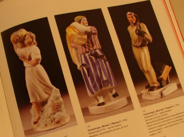
131 Скульптура „Сборница винограда“ 1940–1941 Савицкий И. Л. – автор модели (7) Высота, ростом: В. 23 Без марки, в массе цифра „34“ Figure Grapes Gatherer 1940–1941 Model by I.L. Savitsky Biscuit, painting Unmarked, figure „34“ in the paste H: 23 cm

Cup with Suprematist painting of grey and black rectangles Late 1920s Mould arrangement by I.I. Rozhitskiy Suprematist painting by N.M. Suetin Quilon Porcelain Factory Porcelain, overglaze printing Made in Russia; export mark in red overglaze Ht. 5.5 cm