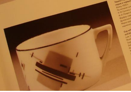
77 Чашка с супротивной росписью серые и черные параллелограммы Концы 1920-х По мотивам супротивной росписи И. И. Сукина, инсталляция на бумаге И. И. Родзественский Фигуры надзорной росписи, В. В. Деловский, фотобумажный эскиз. Масля красками надзорная роспись "параллель", Made in Russia

Mixing with lid with Suprematist painting of red disk and grey, black and red rectangles Late 1920s Mould arrangement by U. Rohdendorf after Suprematist painting by K. S. Yu. Dubrov Potlavin-Factory Porcelain, overglaze painting Red rectangle, square mark with inscription in Arabic for countries of the Middle East Ht. 10.3 cm