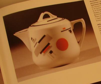
16. Малецким с армянским с супрематическим расположением с красным делением и черной краской на черном фоне. Контраст 1932 По методу супрематического деления И. М. Суткина, черная линия на фоне И. И. Родченкова Фигуры на черном фоне, 8. 1932 Деление фигур на черном фоне И. М. Суткина, черная линия на черном фоне, деление на черном фоне, деление на черном фоне

An allegory of the Russian Revolution that hit Russia in 1921.