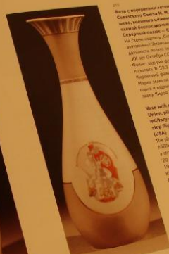
Vase with portraits of Heroes of the Soviet Union, pilots M.M. Gromov and A.B. Yumatov, military engineer S.A. Davlinton and plan to stop flight Moscow - North Pole - San Francisco (USA) The plan bears an inscription: "Sovieters are faithful! A new world record in flight the straight line established" On the under 20 years of October Revolution USSR 1937 Kirov Palace Factory ... ..

base with portraits of Heroes of the Soviet Union, pilots M.M. Gromov and A.S. Yumashev, military engineer S.A. Danilin and plan to stop flight Moscow - North Pole - San Francisco (USA). The plan breaks an international "barrier" and sets a new world record in flight time.