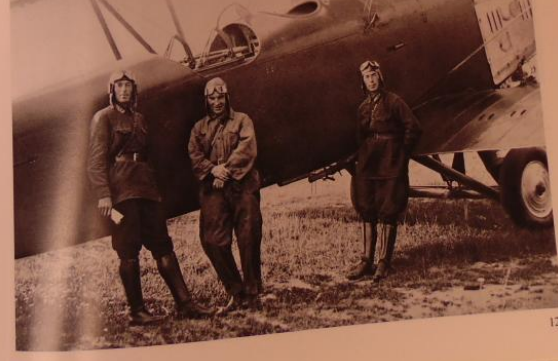
В. П. Чкалов с летчиками-испытателями 1911 ВВС. 1911 г.

Первый же полет чуть было не привел к серьезному происшествию. Поначалу предполагалось, что рядом с Залеским полетит я и огледаю истребители. Несмотря