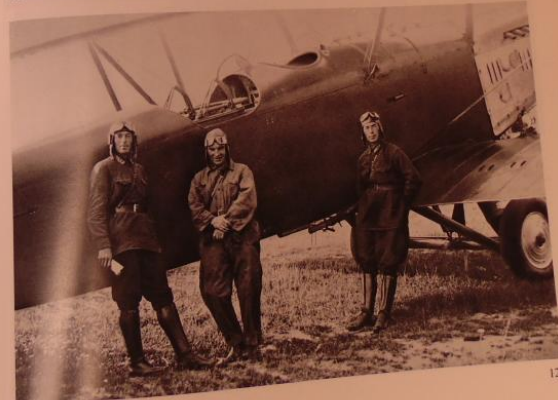
В. П. Чкалов с истребителями 1931-1933 гг.