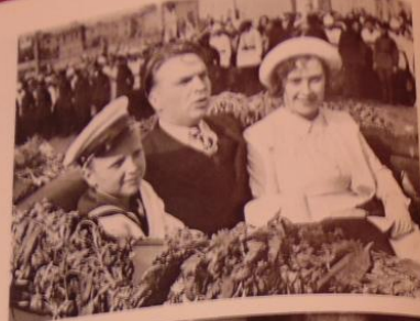
В Кремле на параде в честь победы в войне