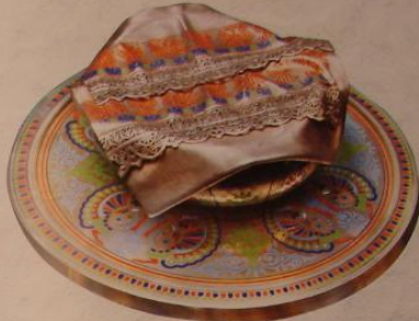
Серебряная чаша, выкованная в технике перегородчатой эмали с криной стилизованной под золотом. Изготовлена в честь Столетия Лейб-Гвардии Казачьего полка в 1875 г. Выпущена в Санкт-Петербурге под руководством Дмитрия С. В. Павлова (Павловича). 1874 г.