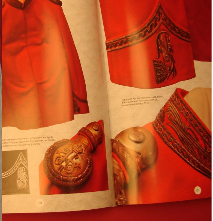
Парадный мундир поручика 1890 г. с вышивкой полевых знаков, вышитым в 1890 г.