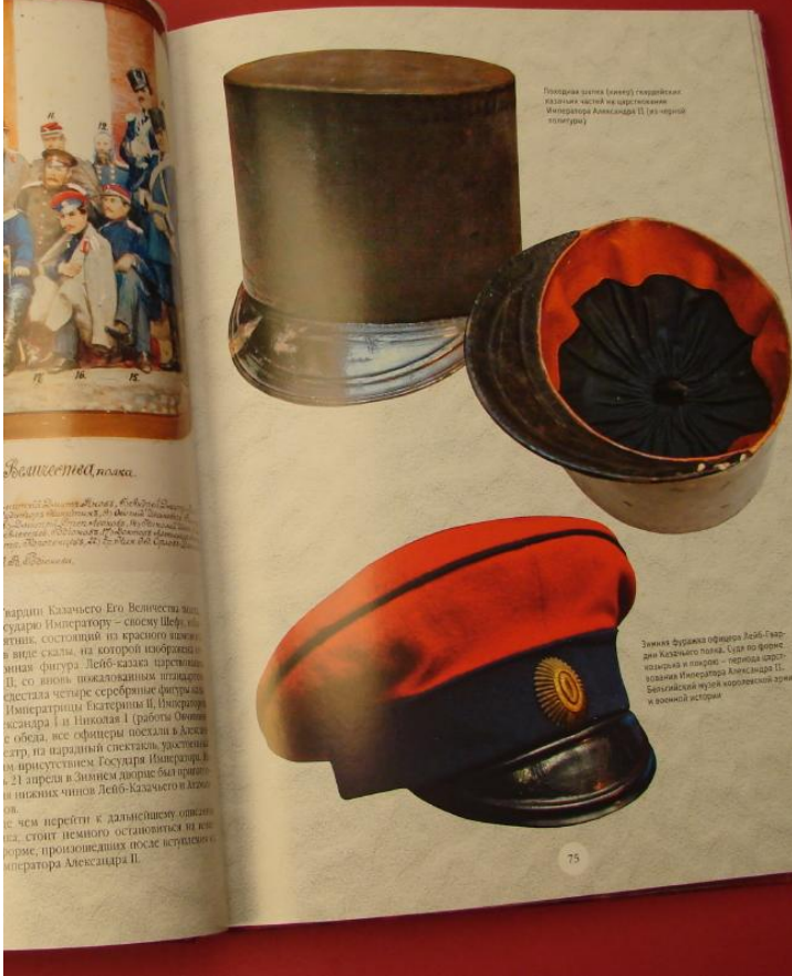
Полковой шляпа (шлем) генерал-лейтенанта Казачьего на портрете Императора Александра II (в черной пелеринке)