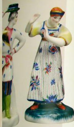
«Павучи и павучи»

Выполнены по образцам 1880-х годов. Роспись фигурки по рисунку Е.П. Мухоморова. ГДЗ - №93, 1923 год.