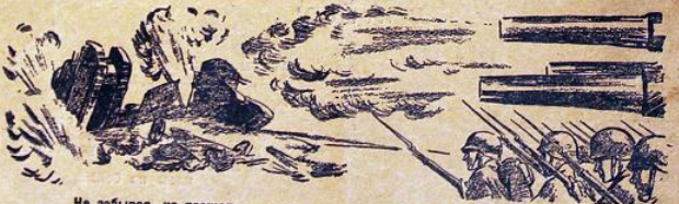
Не забывая, но прощая, Одним движением вперед,