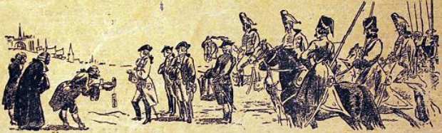
Потом напомним день поделенья Последних ердненских знамен,