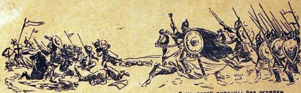
Мы им напомним по порядку Сначала грозный день, когда