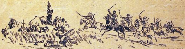
Напомним, чтоб не забывали, Как на полбрьском холоду