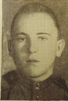
Старший сержант Т. И. МОРОЗОВ Герой Советского Союза

Четыре суток вел бой с превосхо- дящими силами противника и за это время подбил на своего срудия два немецких танка «Тигр», сжег само- ходное судно «Фаринант», уничто- жил 6 вражеских минометов, на- сколько пулеметных точек врага и истребил свыше 150 немецких солдат и офицеров.