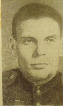
Гвардии капитан В. Г. МАССАЛЬСКИЙ Герой Советского Союза

Провел целый ряд смелых дерзких атак с автоматиче- ской своей роты и проявил в бою личный героизм и выдающее воинское мастерство.