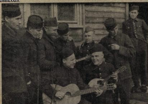
Военнопленные бойцы и командиры, переодетые в новую форму, могли бы исчерпывающе ответить на рассказы о „немецких зверствах“.