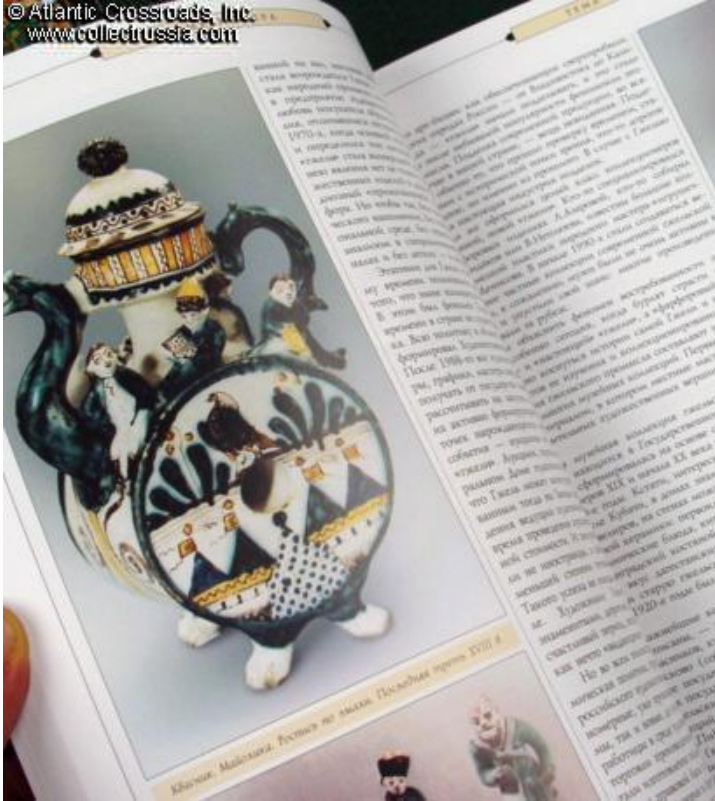
Клоуны. Майская. Вещи во время. Подарки отцу 1911 г.

Материалы с таким значком публикуются на правах рекламы