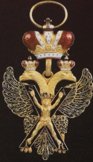
2. Знак ордена Св. Андрея Первозванного 1820г. Золото, эмаль.

имание ния и, как коллекций, ие знаки, ктер. тому кация йших ий.*