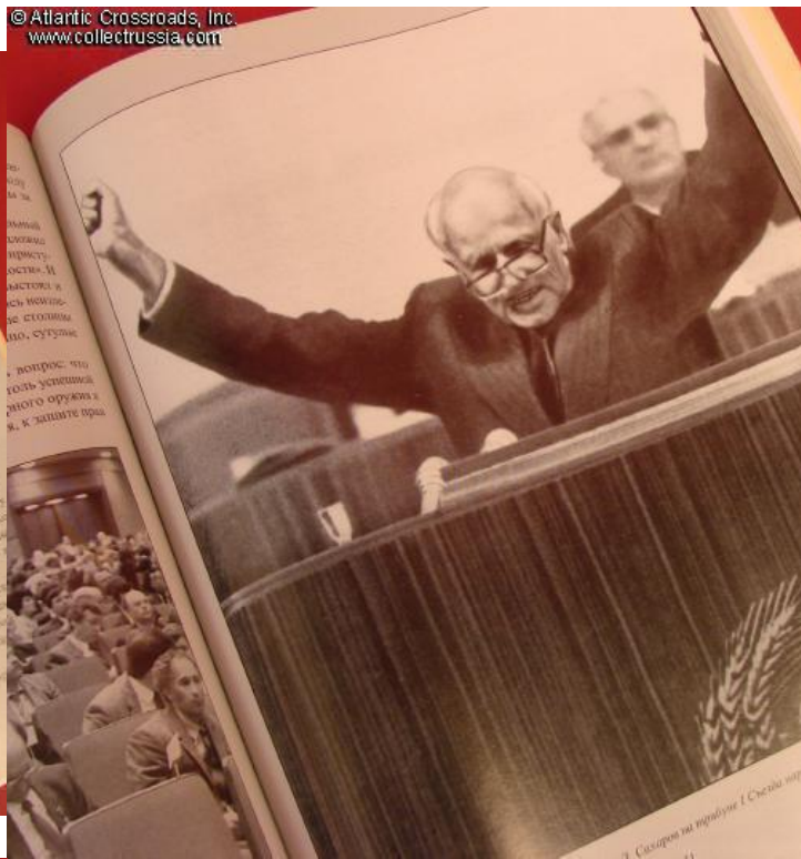
Государственный приемный зал ЦК КПСС

В одном из интервью Кожуб рассказал, что в то время, когда он находился в плену, он был свидетелем того, как немецкие солдаты убивали советских солдат. Он видел, как солдаты умирали, и он был свидетелем того, как немецкие солдаты убивали советских солдат. Он видел, как солдаты умирали, и он был свидетелем того, как немецкие солдаты убивали советских солдат.