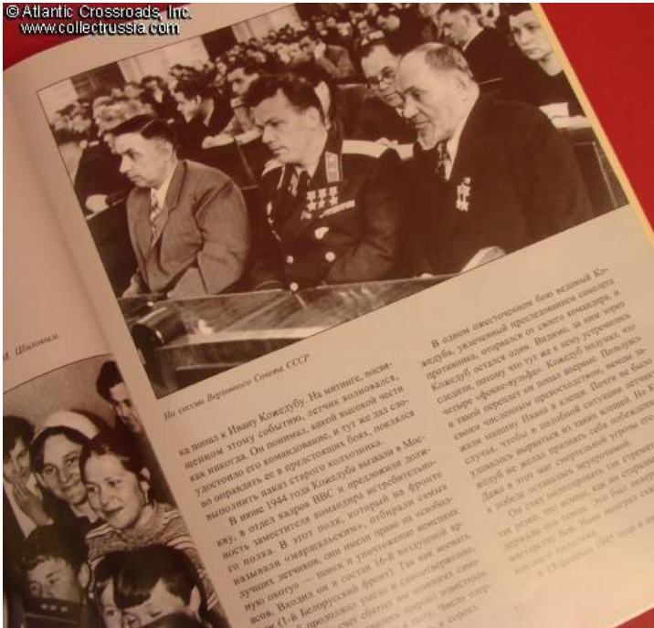
На сессии Верховной Совета СССР