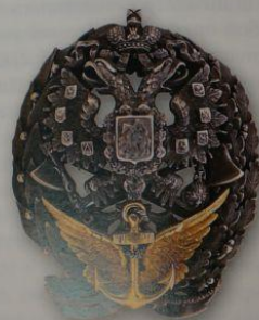
65. Знак за окончание офицерского Воздухоплавательного класса (вар. 1)

Приказом по Военному ведомству за № 48 от 6 марта 1896 г. для окончивших курс офицерского класса учебного Воздухоплавательного парка был утвержден особый нагрудный знак. Основу знака составляет