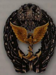
66. Знак за окончание офицерского Воздухоплавательного класса (вар. 2)

приятелем, в четырех морских сражениях взятии десяти крепостей.