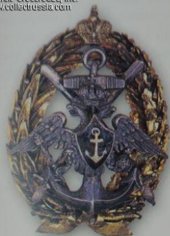
73. Знак за окончание морского отдела Курсов гардемарин флота

Существует жетон в память плавания воспитанников Морского корпуса на крейсере «Князь Пожарский». К сожалению не удалось установить его плавания. На крейсере «Князь Пожарский» в качестве учебного судна плавал с 1906 по 1911 г. Однако, жетон промок и не сохранился.