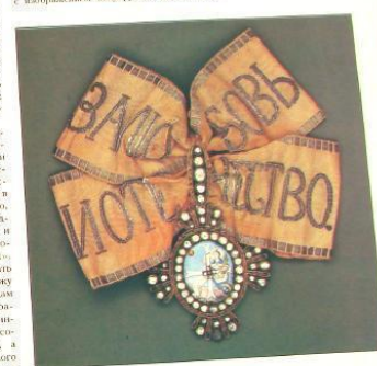
Знак «удосто- ен Ефесского 2-й степени» удостоенный благочинный ПМ

бывши и святошество». Знаки Божьего креста должны быть крупнее и богаче украшены, а крест — «посильно одушен» — оживлен, одеск как живностью, так и в украшении богатством... О людях в уставе нашего не сказано, но уже в петровские времена появились и гонимые. Сначала проповидной формы, затем повсюднотельные. Истощившись же на серебра и в XVIII в. обычно украшали бриллиантами и алмазами, а в центре помещали красивой эмалью медальоны — изображение покровителя, креста и др.