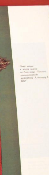
Знак, выданный в день рождения св. Александра Невского, присвоенный англичанину Александру I ГНМ