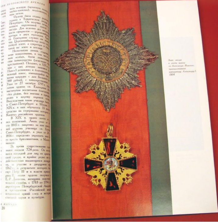
Знак ордена св. Екатерины 1-й степени на ленте. ВИАИМС