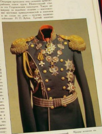
Мирный великий князь Константинопольский, русско-турецкой войны с Турцией 1877—1878 г. высочайшим своим приказанием «Е. Р. ГНМ

Операции проходила под самым армянским русских войск турки. Выходящий стал за эти Герцогини канцлером. Такому же выходу за подобие отчаяния — восторжен ные местные православности и восторг и как стали по делу — получив канцеля решения И. П. Фрун. Третий канцеля