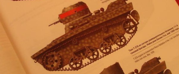
Танк Т-37А в процессе высадки на берег. Видно, как танк движется по воде. 1935 год.

Т-37А был разработан в 1935 году. Его конструкция была основана на опыте высадки десанта на берег. Танк имел гусеничный ход и был способен двигаться по воде. Он был разработан в 1935 году. Его конструкция была основана на опыте высадки десанта на берег.