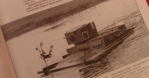
20. Танк Т-37А (бронетанк) в процессе высадки на берег. Видно, как танк движется по воде. 1935 год.

В течение года в снабжении и обслуживании бригады и батальонов (своих катеров, моторов, запчастей) работали на десантно-подъемные суда (ДПС) и десантные транспортеры (ДТ). В течение года в снабжении и обслуживании бригады и батальонов (своих катеров, моторов, запчастей) работали на десантно-подъемные суда (ДПС) и десантные транспортеры (ДТ).